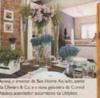
Aqui, o interior da Bee Home. Ao lado, a sede da Oliviers & Co. e a nova geladeira da Consul. Abaixo, aquecedor automático da Utiplast.